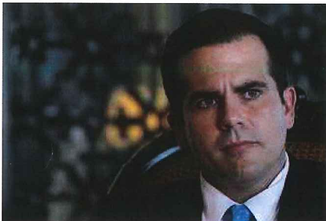
Anuncia impulso para empresas de manufactura de alimentos y bebidas